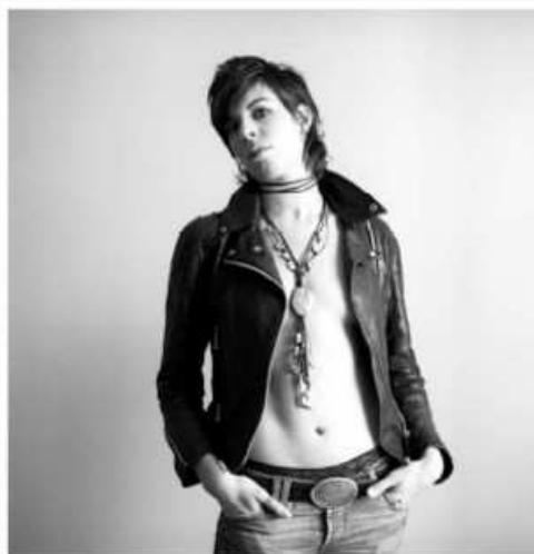
Mademoiselle K.

espetáculo faz parte da Semana da Francofonia da Aliança Francesa, evento que promove diversas atividades abertas ao público por todo mês de março.