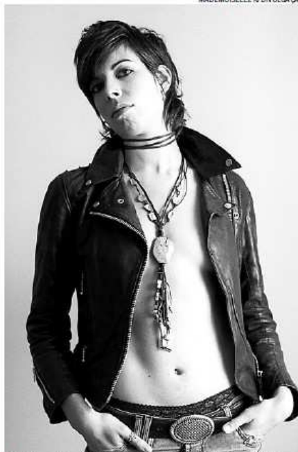
Katerine Gierak se apresenta hoje em show gratuito